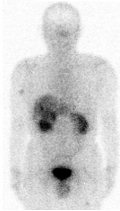
^{111}\text{In} -ペンテトレオチド (SPECT 製剤)